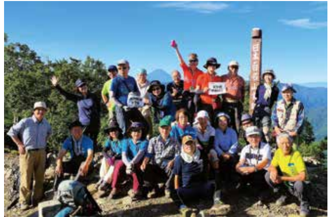
雲取山頂にて

現職であった頃からの経験を通し、山岳救助は山登りの危険以上の危険が伴うものであると思っている。配下の隊員が出動する度に、心痛な思いで無事帰還を願い続けている。山登りの際には絶対に事故を起こさないとの気持ちを心がけるようお願いしたい。埼玉県の救助体制ではあるが、警察32人に消防(ヘリ隊員)2名、航空ヘリでは警察(捜索)3機、消防(搬送)3機の体制で行っている。県内の山岳遭難事故は毎年60件以上起きており、死亡が年毎に5～10人となっ