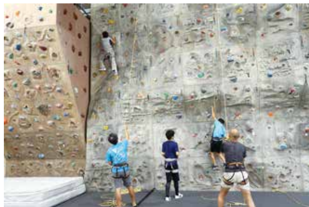
クライミング体験