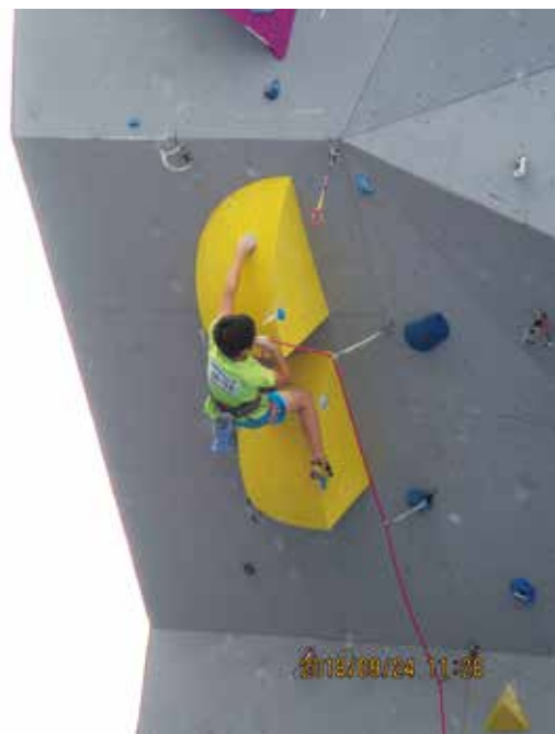
ア楽選手のファイナルトライ

（尚、競技結果については http://sangaku-osaka.com/ をご覧ください。）