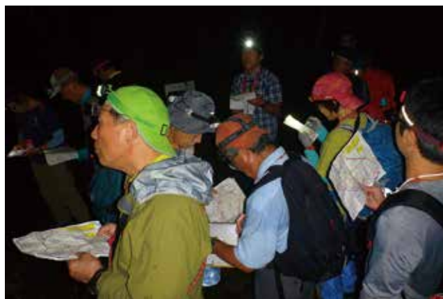
夜間研修「道迷い体験」